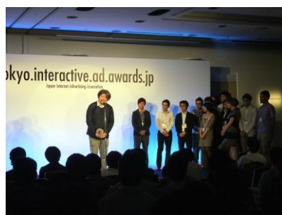
《グランプリ受賞者》